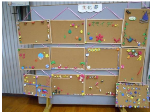
【PTAガーデニングクラブ作品】