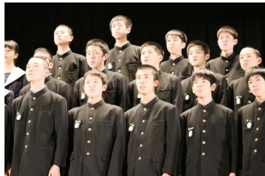
○3年1組 名づけられた葉